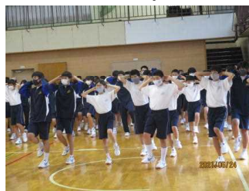
「だるまさんが転んだ」の静止は、各クラスで指定されたポーズで!