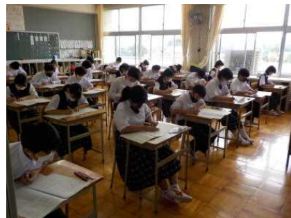
1年生のテストの様子